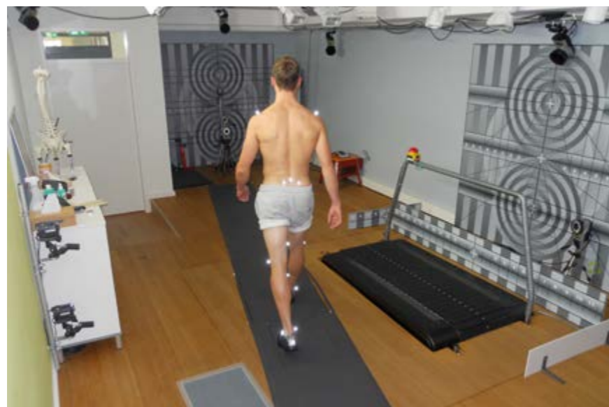
Mess-Setup für die Bedingung Matte

Die am häufigsten eingesetzte Methodik zur Untersuchung des Einflusses der Matten auf die Muskelarbeit bzw. die Belastung ist die Elektromyografie (EMG). Die mithilfe von elektromyografischen Daten erhobenen Ergebnisse zur Muskelermüdung sind teilweise kontrovers. Es konnte jedoch oft ein positiver Effekt der Matten auf die Muskulatur des unteren Rückens nachgewiesen werden.